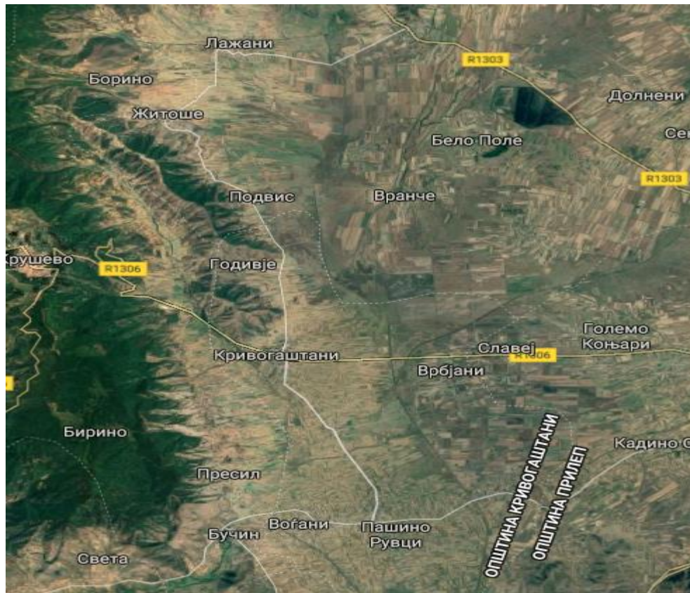
Карта. Население и густина по населби

Опис на недоволно опслужено домување, опслужено домување и нерегуларно. Под недоволно опслужени подразбираме нецелосна понуда на следните услуговодоводна мрежа, канализациона мрежа напојување со електрична енергија и изградена патна инфраструктура.