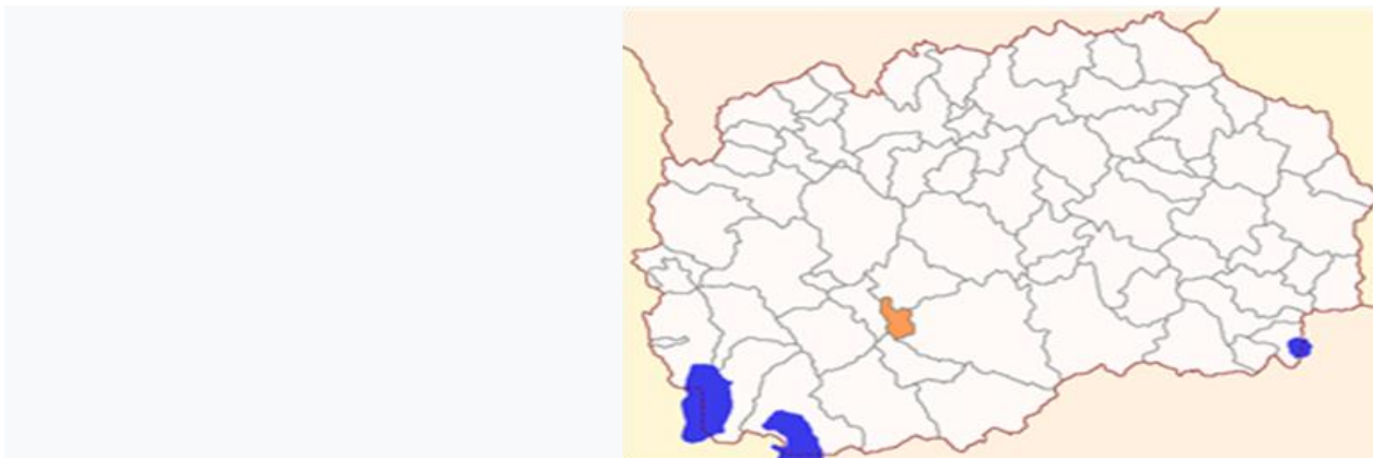
Слика 1. Локација на општина Кривогаштани

Според нејзината надморска височина, таа е вклучена во групата општини со вредности незначително под просекот. Се протега од север кон југ со незначителна деклинација. Се граничи со општината Долнени на север, со општина Прилеп на исток, со општината Могила на југ и со западниот дел на општината Крушево. Општината лежи на апсолутна надморска височина од 615м надморска височина.